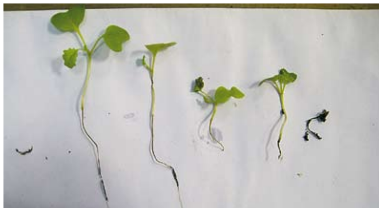
Svarta rötter. Starka angrepp av groddbrand ( Rhizoctonia solani ) i patogenitetstestet gjorde att både rötter och stjälkar snörptes av.

Betningstestet gav ett ganska förvånande resultat. Konventionell betning mot groddbränna hade ingen större effekt förutom i det led där metalaxyl ingick i produkten Cruiser OSR (figur 2). I det ledet fick inga av plantorna några symtom. Det var mer symtom i vissa av de betade leden än i den obetade kontrollen. En orsak till detta kan vara att det sker en rubbning av jämvikten i svampfloran. I de betade leden slog pesticidbehandlingen ut en eller flera svampar och detta kan ge utrymme åt andra konkurrerande svampar att föröka sig och angripa mottagliga plantor och ge symtom. Betningen sänkte grobarheten i flera led, men kan också ha sänkt fröets motståndskraft. En annan orsak till resultaten kan vara att flera av betningsmedlen inte gick ner i roten. Den jordburna smittan infekterar plantan via rötterna och finns inte behandlingen vid roten kan det möjligen uppstå en smitta trots att utsädet är betat. I ledet med den bästa effekten betades fröna med bland annat metalaxyl som ver-