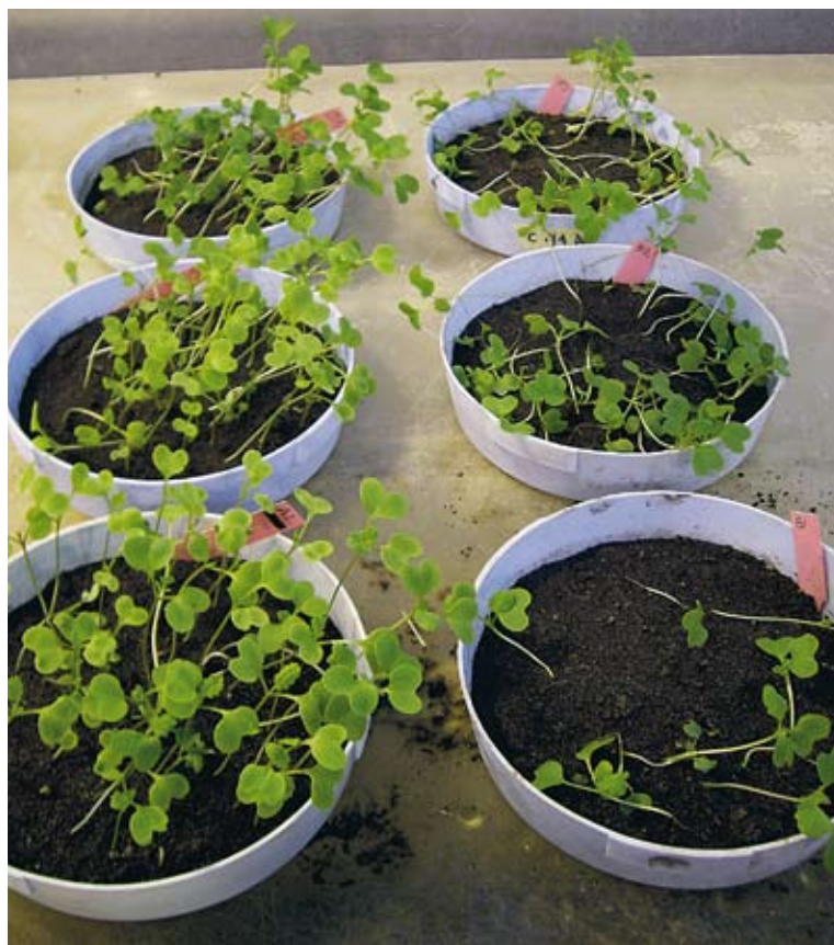
Utglesat bestånd. I patogenitetstestet tillsattes sju olika svampar till steriliserad jord från fält. Smitta av Rhizoctonia solani i jorden (t h) visade sig glesa ut beståndet rejält jämfört med kontrolljorden utan smitta (t v).

Kartläggningen som gjordes av svampar i fält visar på en hög diver-