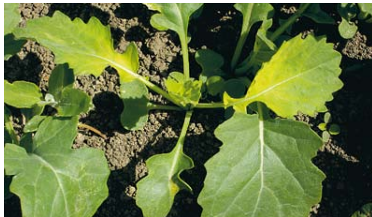
Lätt offer. En rapsplanta vars allmänna kondition sätts tillbaka av t. ex. en ogräsbekämpning blir lättare offer för patogena svampar.