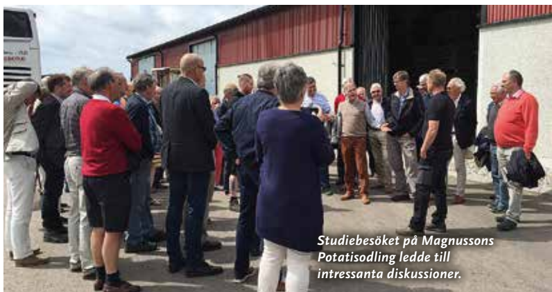
Studiebesöket på Magnussons Potatisodling ledde till intressanta diskussioner.