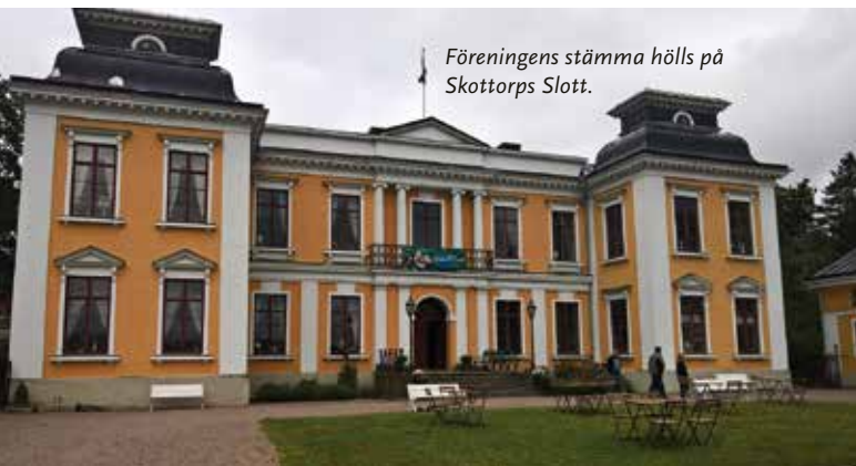
Föreningens stämma hölls på Skottorps Slott.