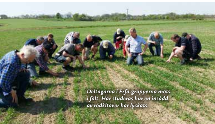
Deltagarna i Erfä-grupperna möts i fält. Här studeras hur en insädd av rödklöver har lyckats.

Stationerna gav råd om växtnäingsstyrning och hur vi ska klara ogräsbekämpning utan Butisan och det ingav hopp. Sortdemon var som alltid uppskattad. Ute i Rapsmästartävlingen visades de tävlings-