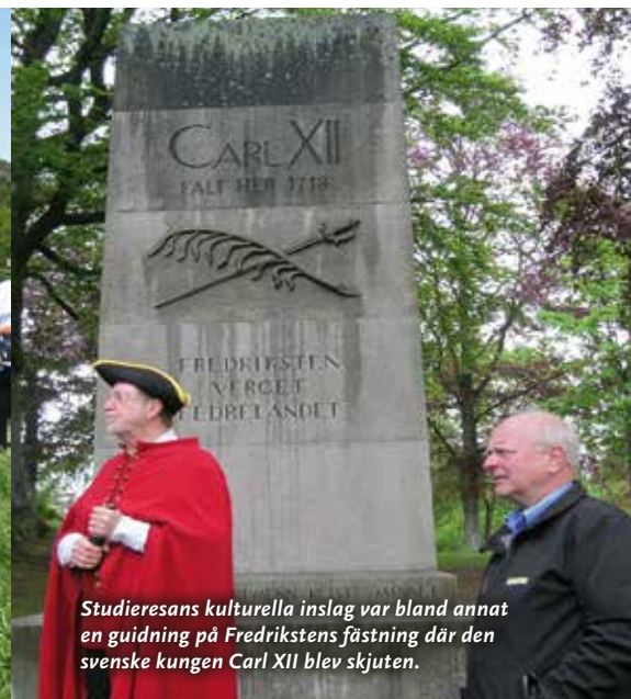
Studieresans kulturella inslag var bland annat en guidning på Fredrikstens fästning där den svenske kungen Carl XII blev skjuten.