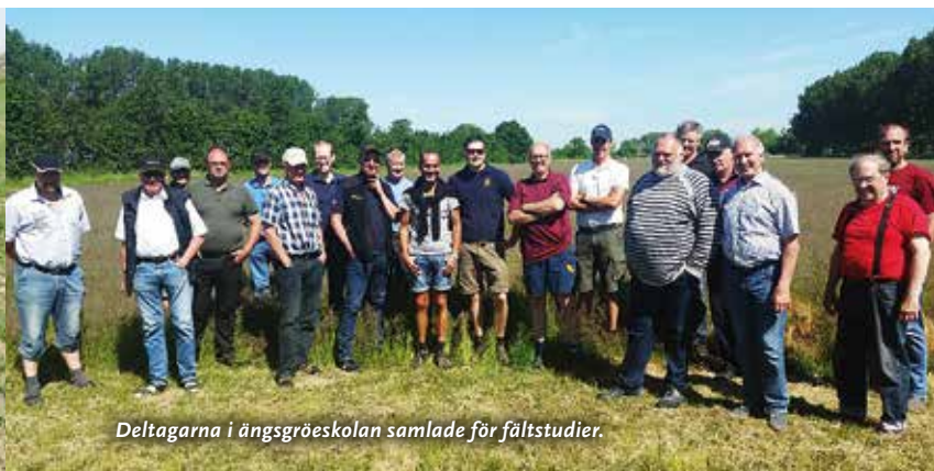
Deltagarna i ängsgröeskolan samlade för fältstudier.