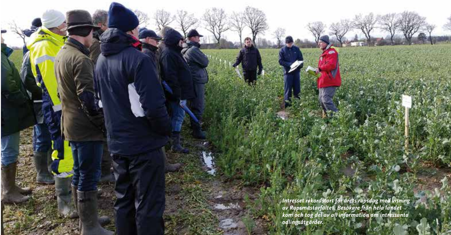
Intresset rekordstort för årets rapsdag med visning av Rapsmästarfältet. Besökare från hela landet kom och tog del av all information om intressanta odlingsåtgärder.

ytor upp som hade speciellt intressanta strategier. Diskussionen kom mycket att kretsa kring beståndsuppbyggnad. Insikten om en bra balans mellan planttäthet och sidoskott blev uppenbar när man studerade de olika tävlingsparcellerna.