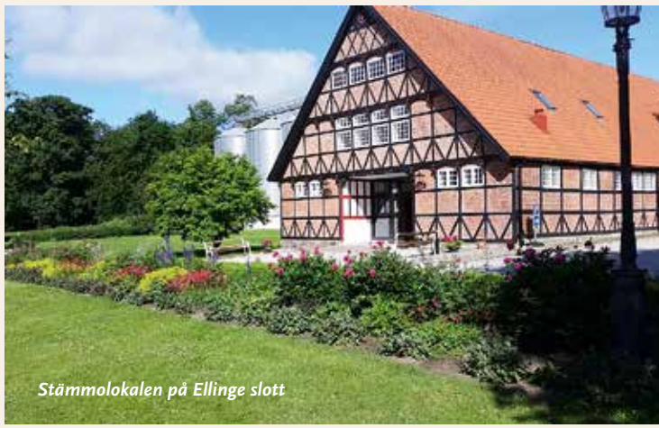
Stämmolokalen på Ellinge slott