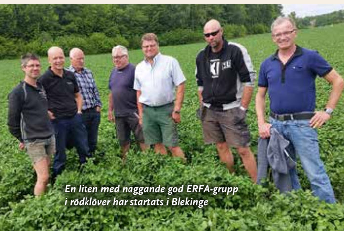
En liten med naggande god ERFA-grupp i rödklöver har startats i Blekinge