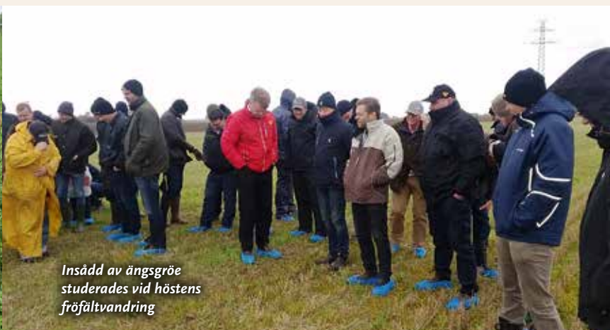
Insådd av ängsgröe studerades vid höstens fröfältvandring