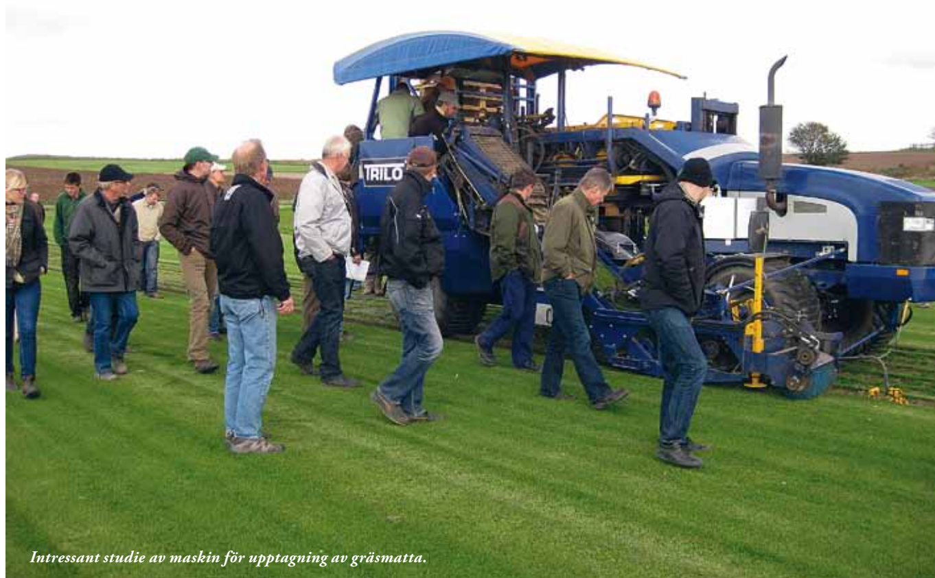
Intressant studie av maskin för upptagning av gräsmatta.

Efter ett besök i en rödklöverodling kom vi till ett rödsvingelfält där flera olika avputsningsmaskiner demonstrerades. Att se maskiner som arbetar i fält är alltid intressant och ger tillfälle till jämförelser och en handfast diskussion om både putshöjd och kvalitet på putsningen.