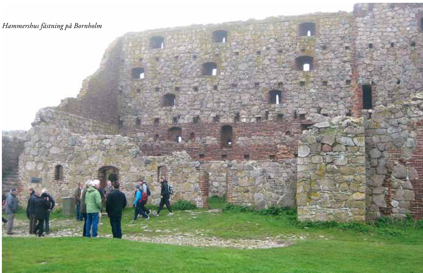
Hammershus fästning på Bornholm