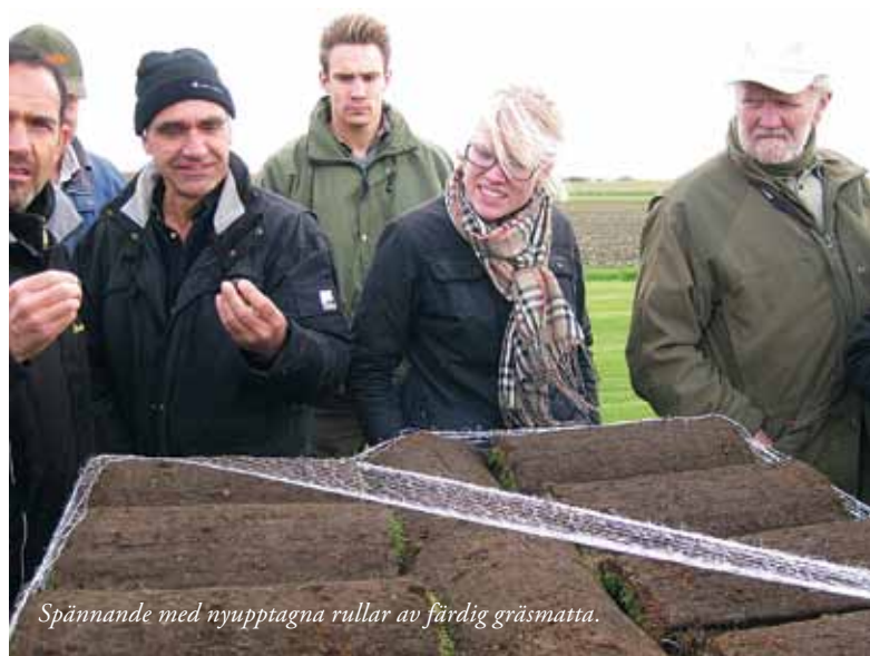
Spännande med nyupptagna rullar av färdig gräsmatta.