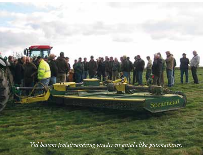
Vid höstens fröfältvandring visades ett antal olika putsmaskiner.