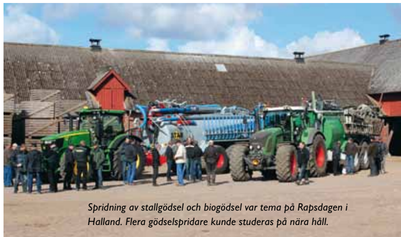
Spridning av stallgödsel och biogödsel var tema på Rapsdagen i Halland. Flera gödselspridare kunde studeras på nära håll.