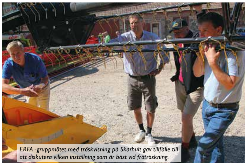
ERFA-gruppmötet med tröskvisning på Skarhult gav tillfälle till att diskutera vilken inställning som är bäst vid frötröskning.