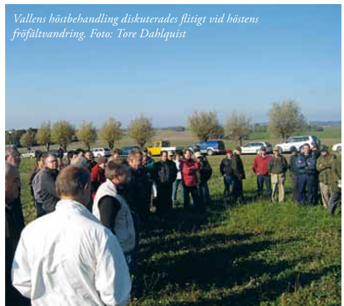
Vallens höstbehandling diskuterades flitigt vid höstens fröfältvandring.