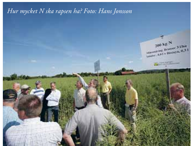
Hur mycket N ska rapsen ha?

I början av oktober arrangerades årets fröfältvandring i trakterna kring Ystad. Som vanligt var uppslutningen god. Hur insådderna såg ut och hur vallarna ska behandlas på hösten var diskussionsämnet. Både vit- och rödklöver, rajgräs, raj- och rödsvingelfält besöktes. Hösttillväxten hade varit god och de flesta vallarna var putsade. Speciellt rajsvingeln hade gett en rejäl ensilageskörd efter frötröskning.