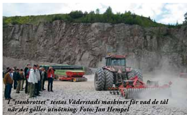
I ”stenbrottet” testas Väderstads maskiner för vad de tål när det gäller utnötning.