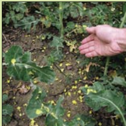
Nimbus CS vid sådd, 3,0 liter.

Den låga dosen Butisan Top har haft svag effekt. Övriga behandlingar har hög eller mycket hög effekt, speciellt bekämpning strax efter sådd, särskilt mot näva.