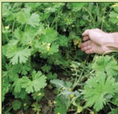
Butisan Top i hjärtbladsstadiet, 1,0 liter.