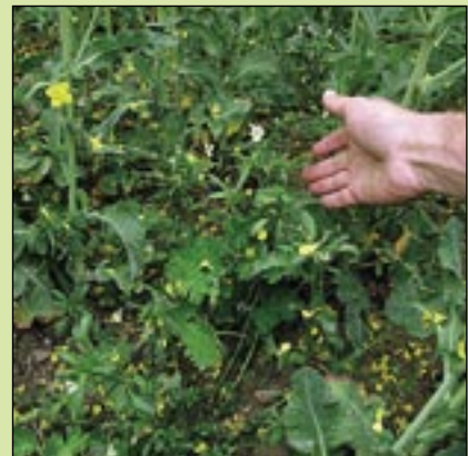
Butisan Top vid sådd, 2,0 liter.