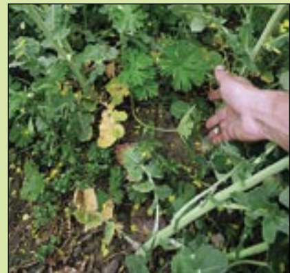
Butisan Top i hjärtbladsstadiet, 2,0 liter.